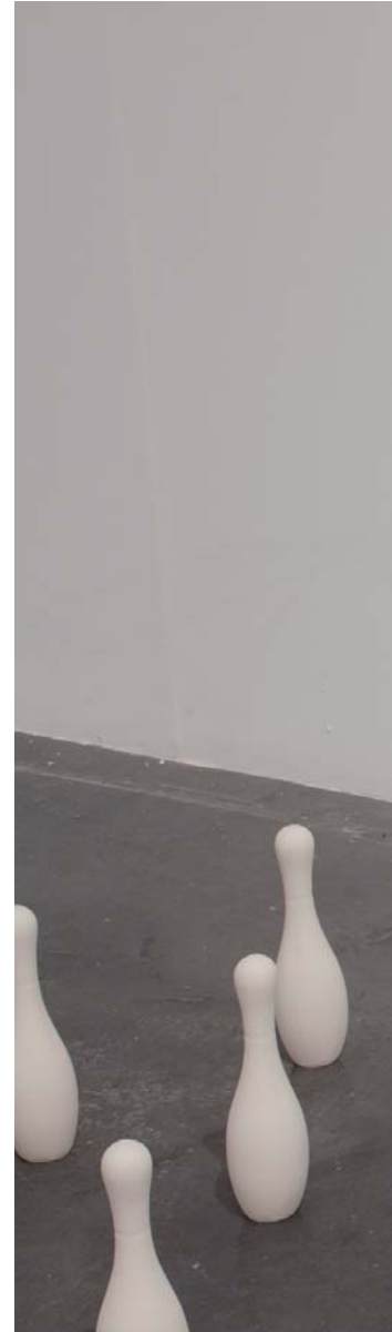
TXIRLOA • BOLO Portzelana • Porcelana 33 x 9 cm