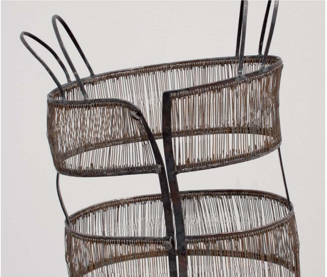
NESKATILA • NIÑA Altzairua • Acero 95 x 50 x 33 cm