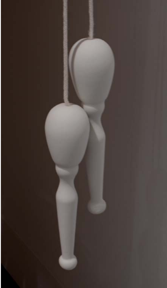
JAUZKARIA • SALTADOR Portzelana eta soka Porcelana y cuerda 17 x 6 cm