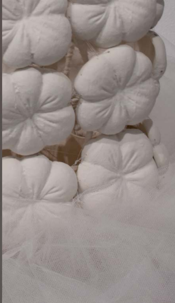
DANTZARIA • BAILARINA Portzelana eta oihala Porcelana y tela 66 x 45 x 40 cm