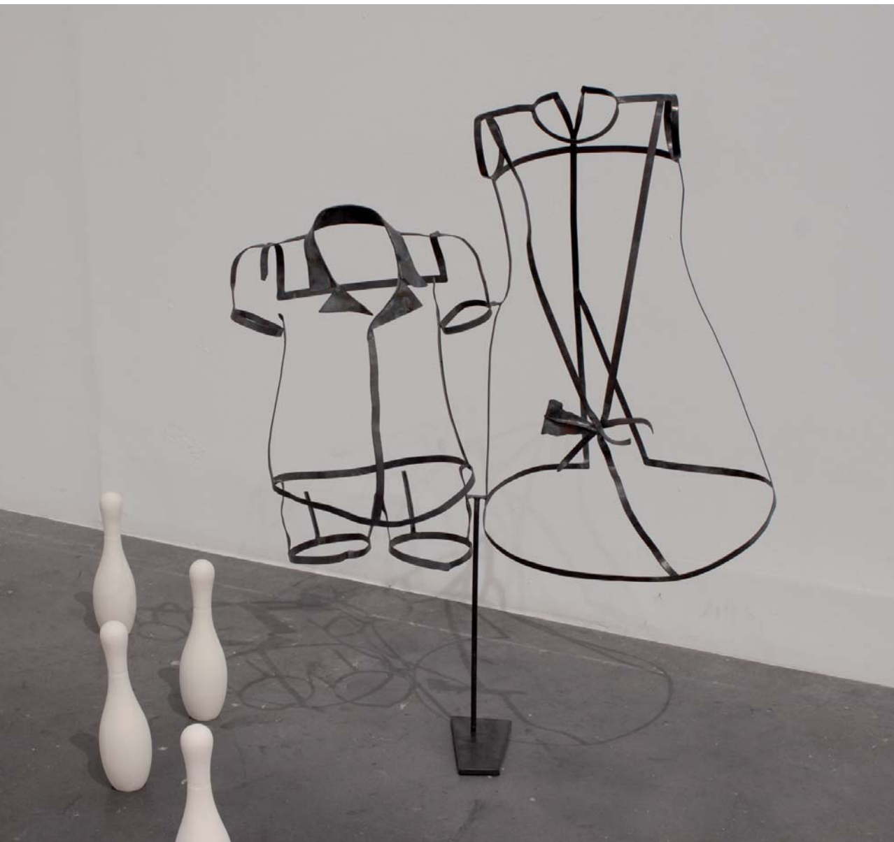
MUTIKOA-NESKATILA • NIÑO-NIÑA Altzairua • Acero 97 x 72 x 36 cm