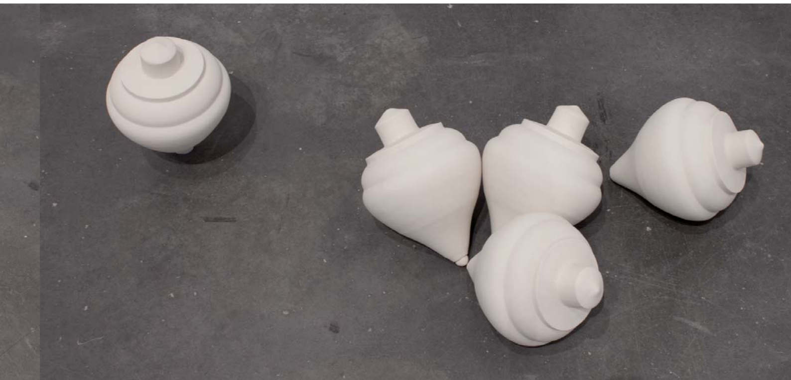
ZIBA • PEONZA Portzelana • Porcelana 24 x 22 cm