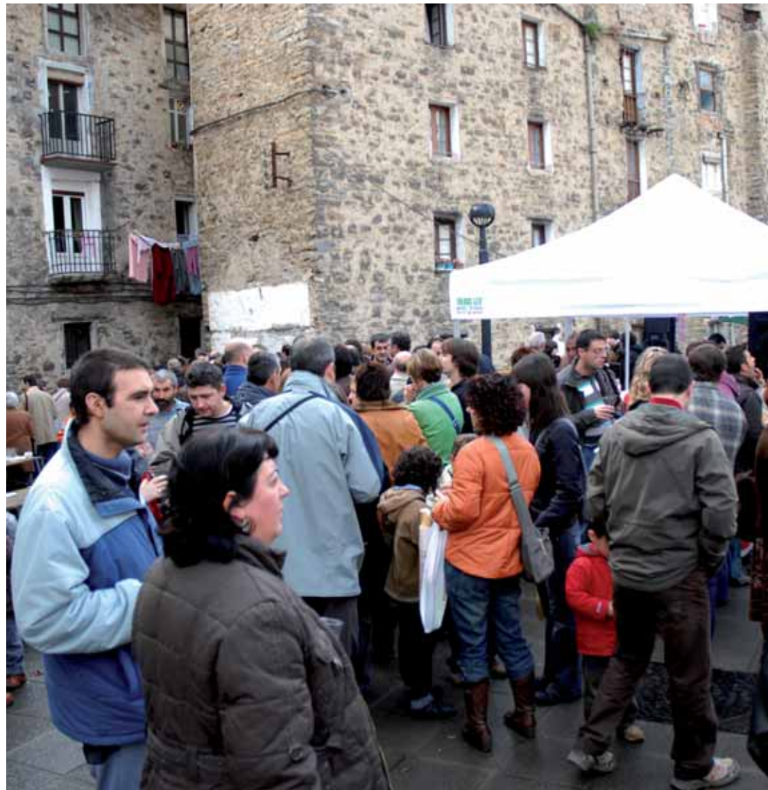
Gure Ametsa elkarteak antolatutako Napar Feria San Antonio auzoan, 2007ko abenduan.

2008an onartuko dituzten aurrekontuetan inbertsio berezia eskainiko dio Gobernu berriak gai horri. Udal batzorde informatiboetan lanean dihardute eta herritar guztien edo gehien iritziak jaso nahi ditu Udalak. Hain justu ere, batzorde horietan parte hartzea dei egiten diete herritarrei. Batzordeetan proposamenak egin ahal izango dituzte herritarrek eta proposak izanez gero, Udal Gobernuak prest dago gauzatzeko. Udaleko ateak irekiko dituzte, arlokako batzordeak sortuz eta hainbat esparru aztertuz. Udalaren hel-