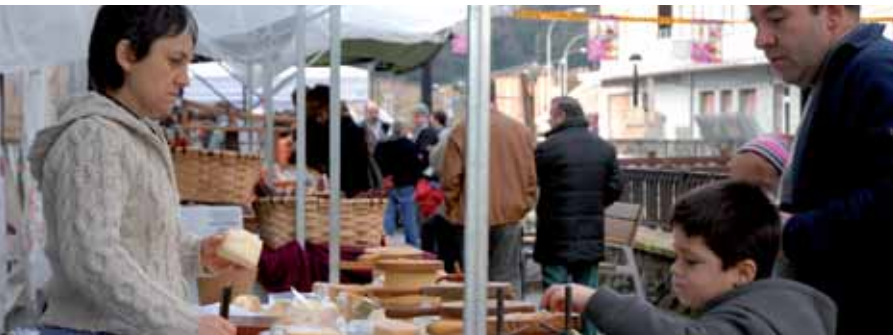
San Antonio auzoan eginiko artisau azoka.

Begarako Udala kezkatuta dago herriko kaleetan bizitarik ez dagoelako. Egoera hori irauli nahi du Udal Gobernu berriak eta horretarako egitasmoak abian jarri nahi ditu. Helburua da aisialdi eskaintza zabaltzea eta Bedelkar merkatarien elkartearekin batera herriko komertzioa sustatzea. Oraindik asmoak besterik ez dira, baina aurrean onartuko dituzten aurrekontuetan partida bereziak bideratuko dituzte.