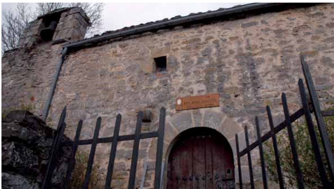
Aritzetako San Migeleko basilizako ataria.

Bergarari buruzko historian hurrengo aipamena irakurtzeko Gaztelako Alfontso VIII. enak 1200. enean Gipuzkoako lurrak Nafarroako Erresumari indarrez kendu zizkionera arte itxaron beharko dugu. Izan ere errege gaztelarrak bereganatutako gazteluen artean Elosun zegoen gaztelu bat aipatzen da, berau 1457an Enrike IV. enak suntsitu zuen.