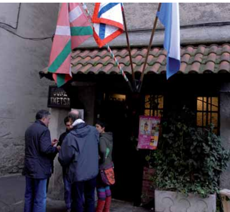
Gure Ametsa elkarteko ataria eta jantokia.