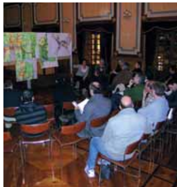
Plangintzako Aholku batzordearen bilera.

Bergarako Plan Orokorrak badu behin-behineko onarpena eta hasierako proposamenaren gainean hainbat helegite aurkeztu dituzte herritarrek. Aholku Batzordearen egitekoa alegazio horiek aztertu eta horien inguruko iritzia ematea izango da, ondoren Udalak erabakia har dezan.