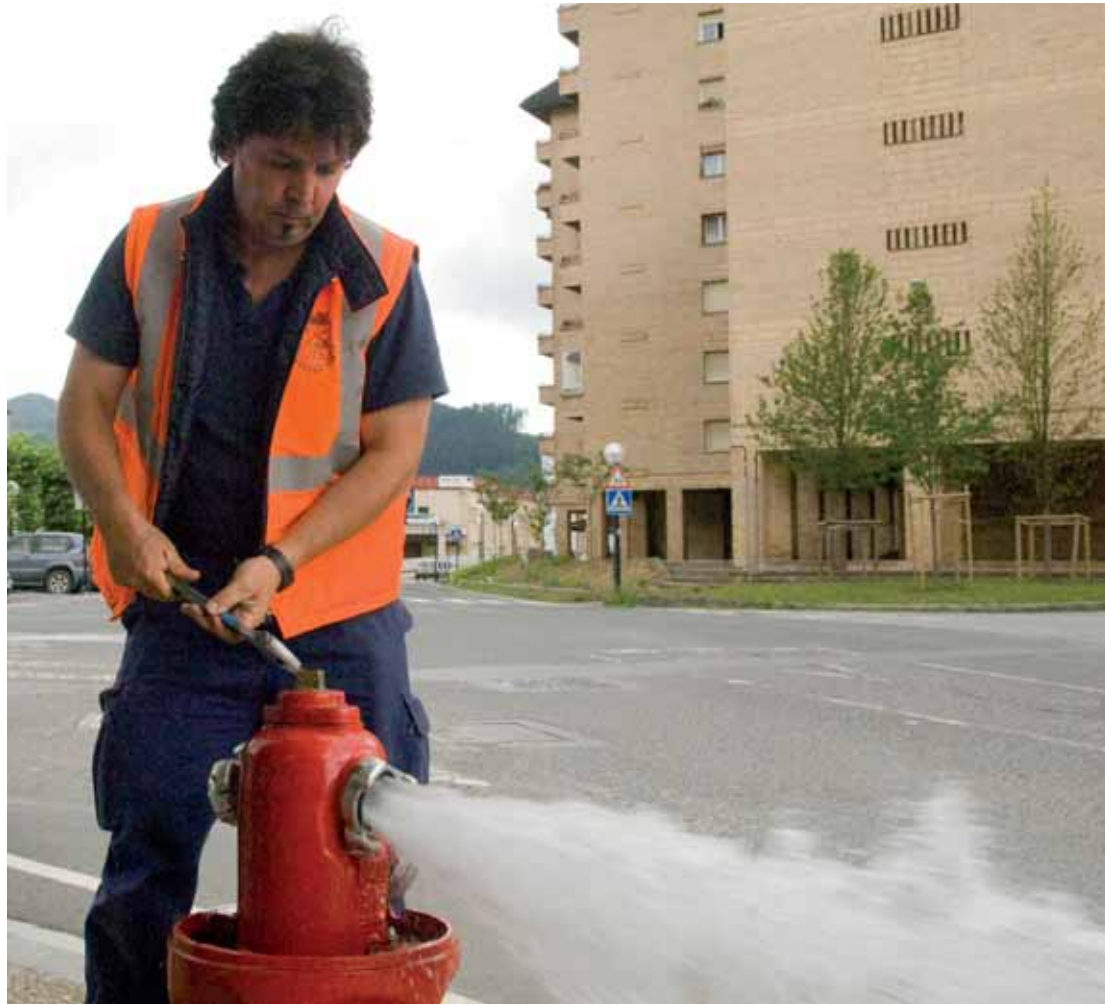
Ur zerbitzuko langilea jarduera bat burutzen.