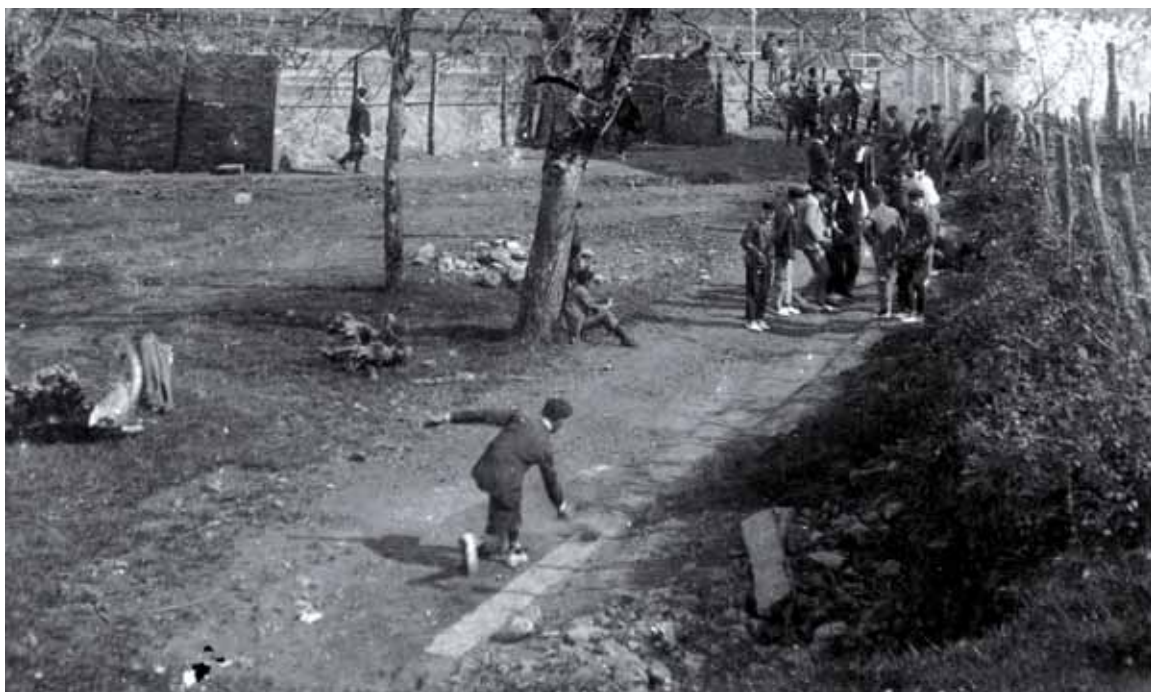
Agorrosin baserriaren eta futbol zelaiaren ondoan zegoen bolatokia. 30eko hamarkada.