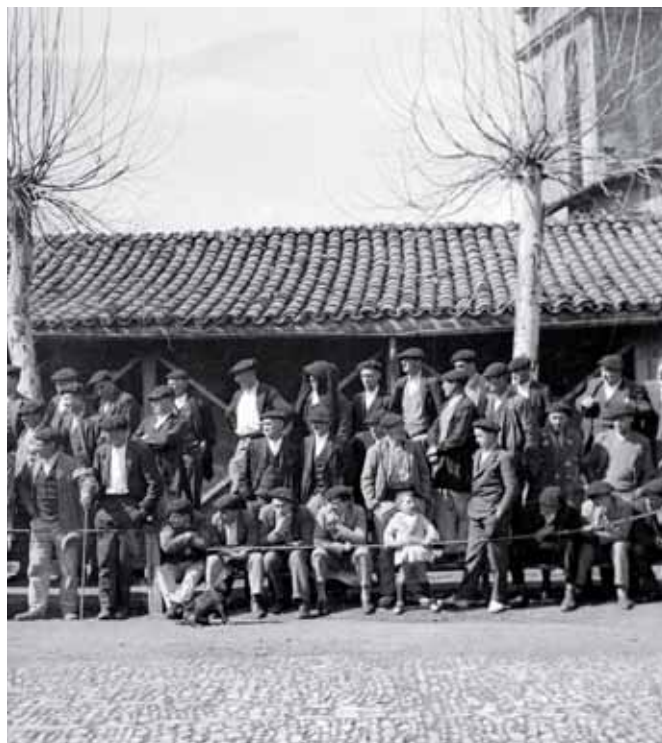
Atzealdean ikusten den eraikina da bolatokia. 1933an.