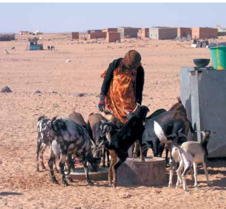
Saharako errefuxiatuen kanpamentua.

Zorte ona dakarren txori baten izena da Bubisher. Izan ere, berri onak ekarri omen ditu Saharako errefuxiatu kanpamentuetan agertzen denean. Metafora horri jarraiki, Saharako herriaren beharrei erantzuteko sortu zen Bubisher elkarte.