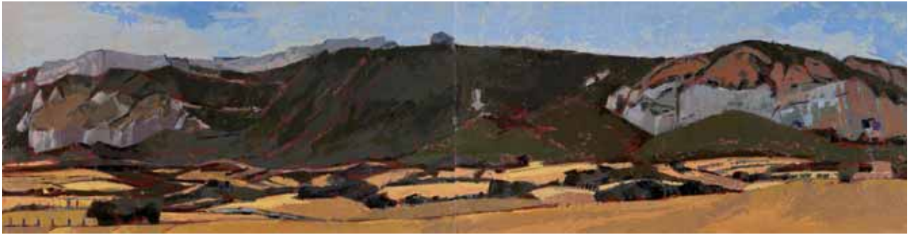
Kantabri mendilerroa, diedrikoa