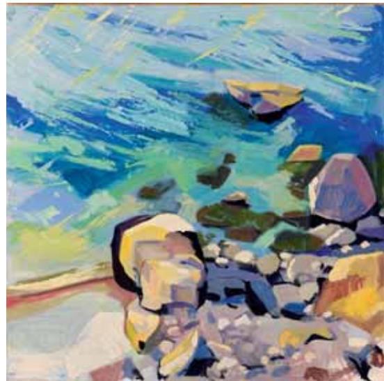
Costa Brava 2