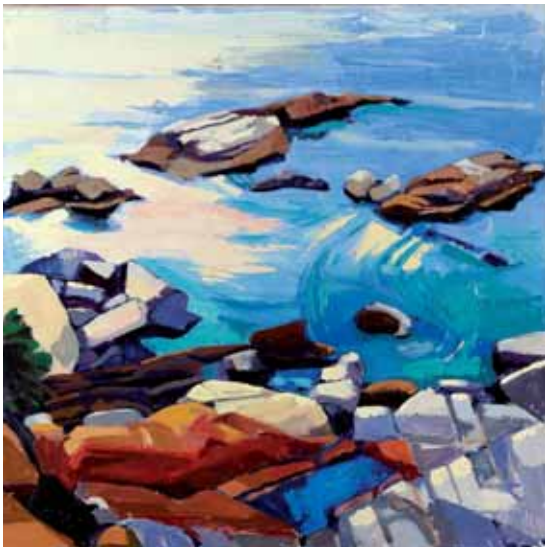
Costa Brava 1