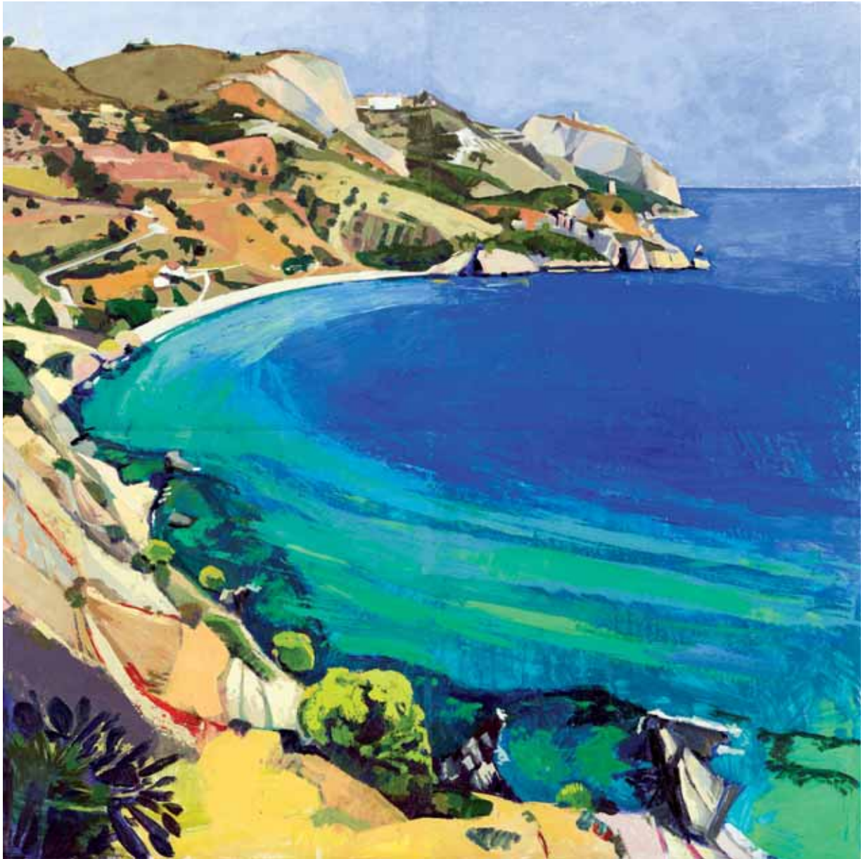
Maro eta Cerro Gordo, Málaga