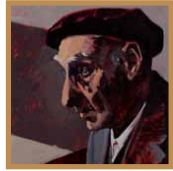
Aita, Ama eta Xegundo