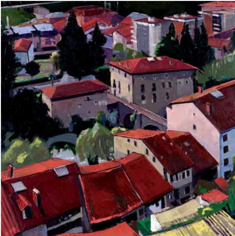
Zubitta goiko trenbidetik