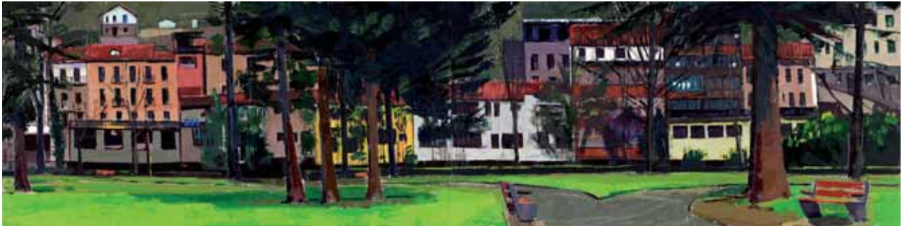
Usondotik Zubittara begira