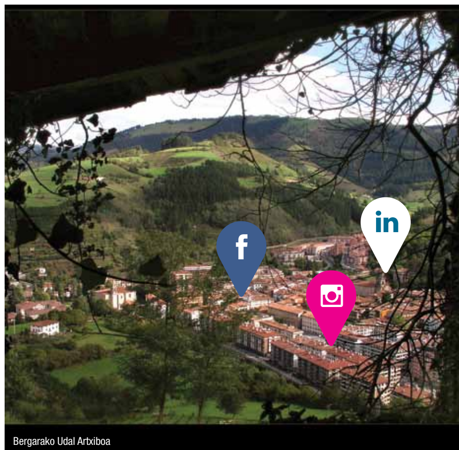
Begarako Udal Arxiboa

Etorri Bergarara! Partekatu gonbidapen hau zure kontaktuekin!"