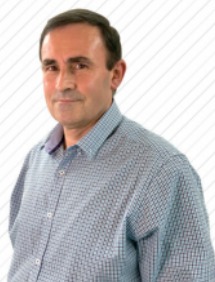
JUANJO ASULA TXURRUKA ZINEGOTZIA

Herritarrak arloko lehendakaria Euskara Gazteria Komunikazioa Partaidetza Hezkuntza earanberri@bergara.eus