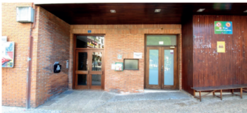
Frontoia: Atariko aterpean kalean.