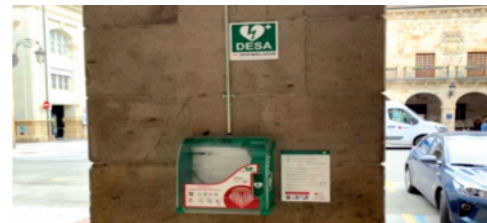
Seminarixoa: kanpoan, sarrera ondoko zutabeen.