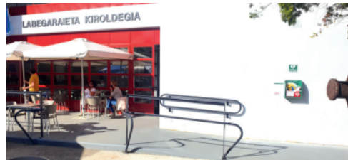
Labegarieta kiroldegia: kanpoan.