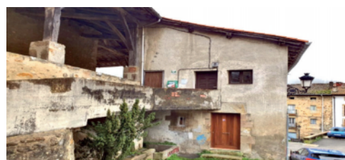
Angiozar: Medikuko kontsultaren kanpoan.