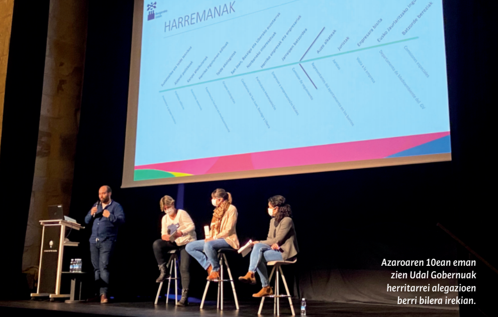
Azaroaren 10ean eman zuen Udala Gobernuak herritarrei alegazioen berri bilera irekian.

El Ayuntamiento ha presentado alegaciones de carácter urbanístico y medioambiental al proyecto que la empresa Valogreene Paper BC, S.L. ha presentado para la implantación de una planta de tratamiento de residuos de la industria papelera en Larramendi.