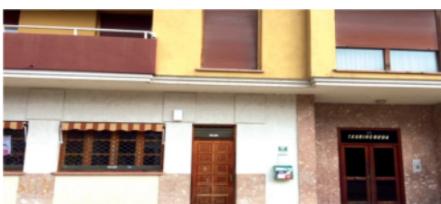
Osintxu: Txuringokoa kanpoan.