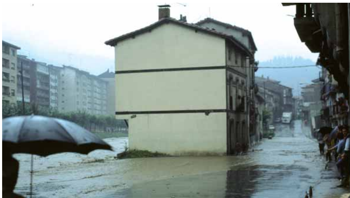
1983ko abuztua

Hurrengo datua 1834koa da. Urte hartan bi uholde egon ziren. Lehena, ekainaren 30ean eta, bestea, irailaren 28an. Orduan desagertu zen Santo Tomas ermita. Zubiarekin batera Santo Tomas ermita irudia San