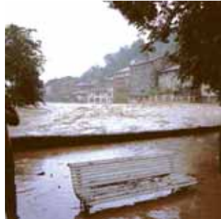
1983ko abuztua