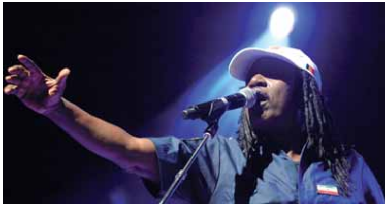
Alpha Blondyren kontzertua.

Munduko kulturen festaren balorazio guztiz positiboa egin du Udalak. Ekainaren 6tik 8ra bitarteko asteburuan izan da aurten, eta eguraldi eta giro onari herritarren parte-hartze handia gehitu zaio.