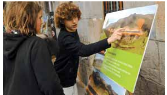
Erakusketa ibiltariko panel informatiboak Bergarako kaleetan.