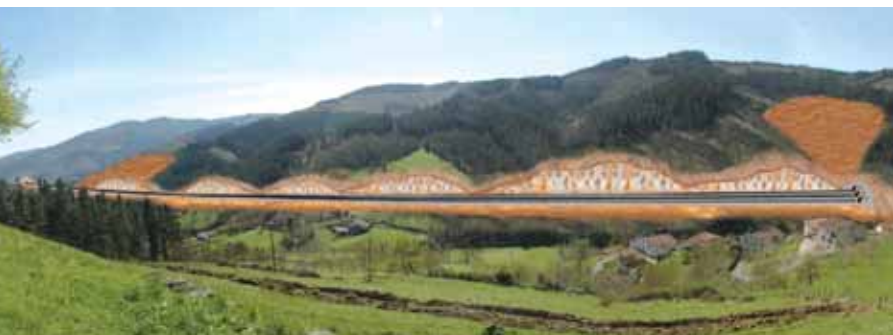
Proiektuaren araberako trazatuaren fotomuntaia.