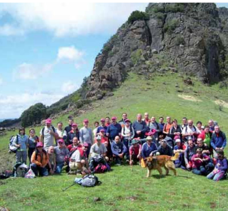
Maiatzaren lehenean lau eguneko irteera burutu zuten Leoneko mendietara.

Pol-Pol elkarteak 1942an sortu zen. Oilagorra eta Aizkar tabernetan egiten zituzten lehenengo bilerak eta ondoren Komenio kaleko elizaren etxera igaro ziren, eta bertan jarraitzen dute. Mendizale elkarteak zazpiahun bazkide ditu gaur egun.